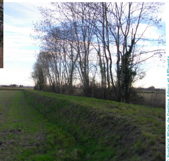
© Syndicat Mixte de Gestion Adour et Affluents